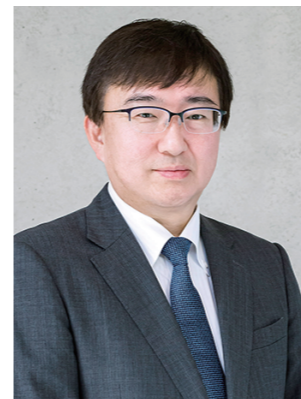
尚美ミュージックカレッジ専門学校